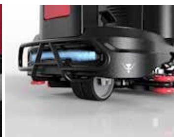
Solidny zderzak z zapewniającym widoczność oświetleniem