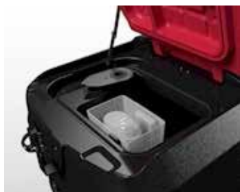
Taca na nieczystości z łatwym dostępem